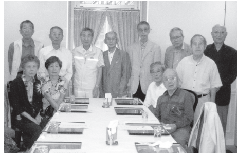
▲経専会最後の集り(2013年6月14日 馬車道相生にて)